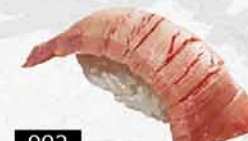
992 炙焼中腩 炙り中トロ Bluefin Tuna Chu-Toro