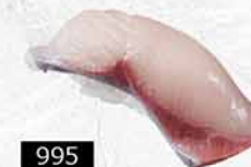
995 油甘魚 ハマチ Yellowtail