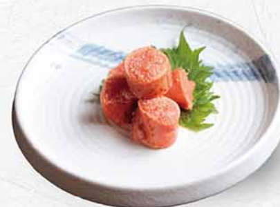
180 焼明太子 焼き明太子 Grilled Cod Roe