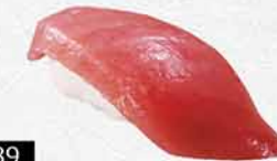
989 特選藍鰭吞拿魚赤身 ホンマグロ赤身 Bluefin Tuna Akami