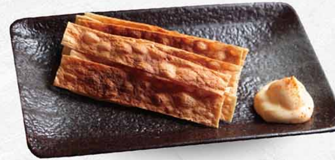
191 焼鱈魚棒 炙りタラロール Grilled Cod Fish