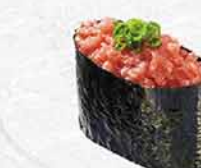
990 藍鰭吞拿魚魚蓉 ネギトロ Minced Fatty Blue Tuna