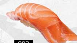
993 三文魚 サーモン Salmon