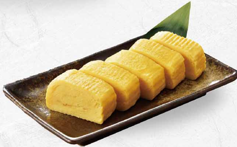
976 自家製厚焼玉子 自家製玉子焼き Homemade Japanese Rolled Omelette