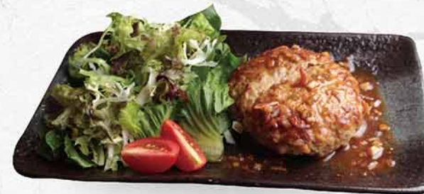
192 和風漢堡 和風ハンバーグ Japanese-style hamburger