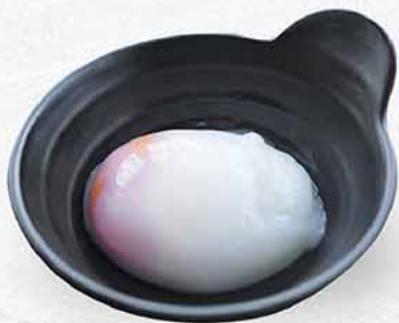
9004 温泉蛋 温泉卵 Japanese Soft-boiled Egg