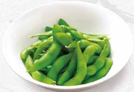
175 枝豆 えだまめ Green Soybeans