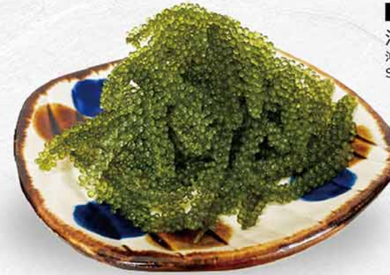
972 沖縄海葡萄 $42 沖縄海ぶどう Sea Grapes