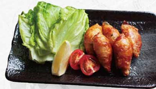
152 鶏皮餃子 ~附生菜~ レタス巻き とり皮餃子 Chicken Skin Dumplin with Lettuce