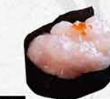
997 甜蝦蓉 甘エビたたき Tartare Sweet Shrimp