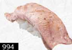
994 炙焼三文魚 サーモン炙り Burn Salmon Sushi