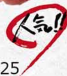
985 特選藍鰭吞拿魚三色壽司 ホンマグロ3色寿司 Bluefin Tuna 3 Kinds Sushi