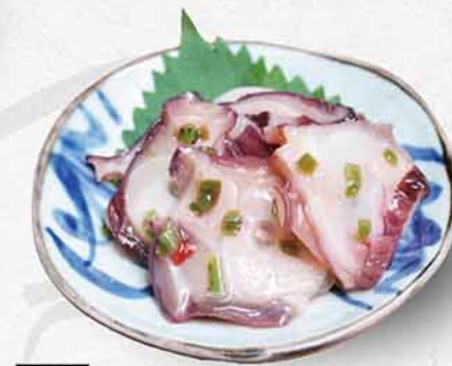
174 八爪魚芥辣漬 $48 タコわさび Fresh Octopus Seasoned with Wasabi