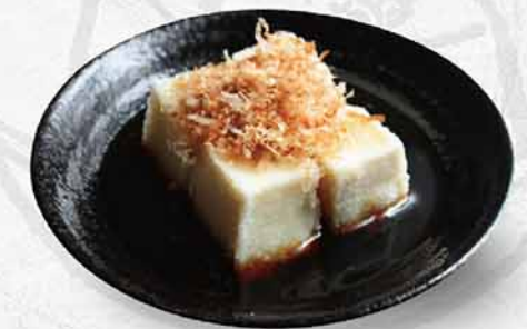
979 高湯炸豆腐 $48 揚げ出し豆腐 Fried Tofu with Broth