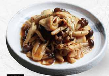
978 牛油雜菇 バターマッシュルーム Baked Mixed Mushroom with Butter