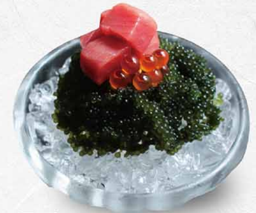
973 吞拿魚海葡萄 $68 ホンマグロ海ぶどう Tuna Sea Grapes