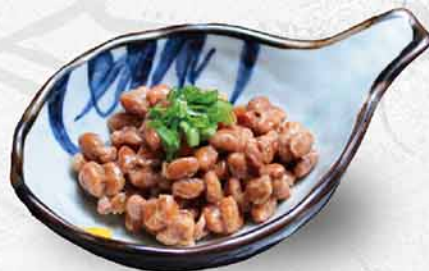
9006 納豆 納豆 Natto