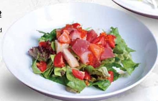
128 海鮮沙律 海鮮サラダ Seafood Salad