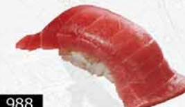
988 特選藍鰭吞拿魚中腩 ホンマグロ中トロ Bluefin Tuna Chu-Toro