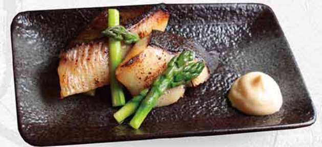
303 銀鱈魚西京焼 銀だら西京焼き Silver Cod Saikyo-yaki