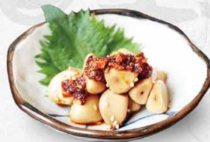
245 蒜肉醬油漬 $38 ニンニク醤油漬け Garlic Pickled in Soy Sauce