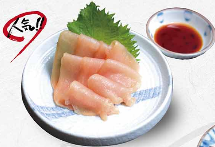
971 日本華味鳥 煙燻雞肉刺身片 はなみどり鶏生ハム Japan Hanamidori Smoked Chicken Slices $78