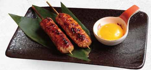
974 免治鶏肉串 つくね x2 Minced Chicken x2