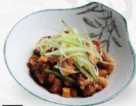
301 柚子醋吞拿魚筋 $38 ぼん酢焼きマグロ筋 Grilled Maguro Tendon with Ponzu