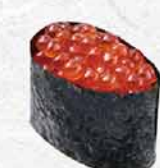
998 三文魚魚子 イクラ Salmon Roe