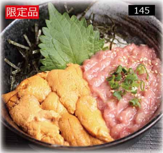
DORAYA豪華丼定食 $318 どらや贅沢マグロ丼セット Doraya Luxurious Bowl Set