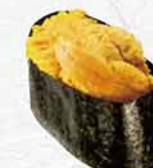
889 海膽 うに Sea urchin