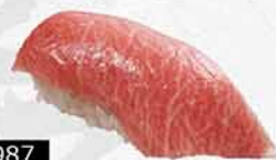
987 特選藍鰭吞拿魚大腩 ホンマグロ大トロ Bluefin Tuna O-Toro