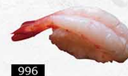
996 甜蝦 甘エビ Sweet Shrimp