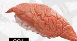
991 炙焼大腩 炙り大トロ Bluefin Tuna O-Toro