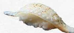
886 左口魚邊 えんがわ Engawa