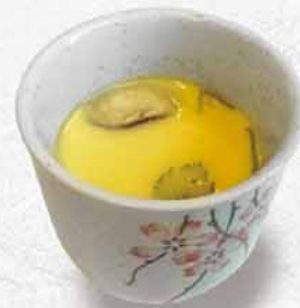
9010 茶碗蒸 茶碗蒸し Chawanmushi