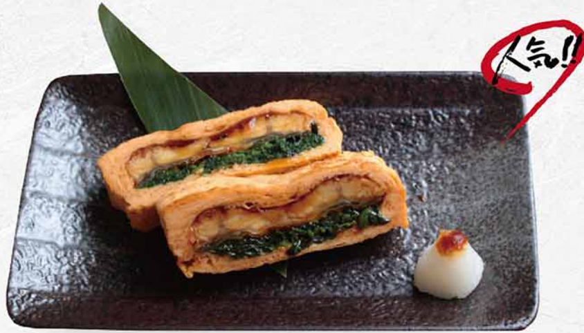
176 鰻魚玉子焼 うなぎ卵焼き Japanese Eel Rolled Omelette