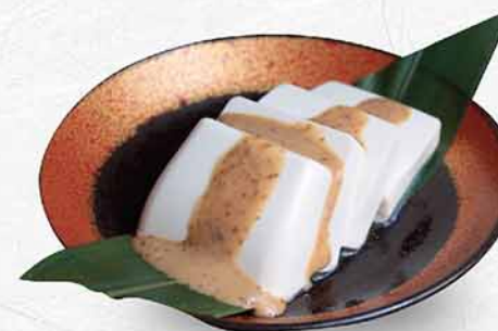
173 和風焙煎冷豆腐 $46 ごまだれ冷奴 Japanese Cold Tofu