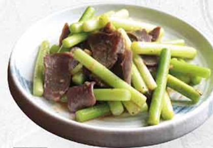
189 蒜芯炒雞腎 砂肝とにんにくの芽炒め Stir-fried gizzards and garlic sprouts