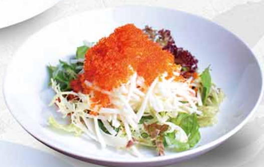
124 蟹子沙律 カニコのサラダ Crab Roe Salad