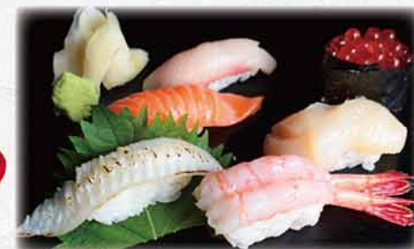
986 特選六色壽司 寿司6点盛り Sushi Platter 6pc