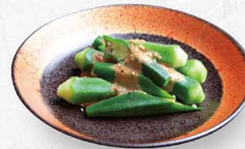
177 芝麻拌秋葵 $32 オクラごまよごし Okra Marinade with Sesami Dressing