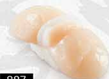
887 帆立貝 ホタテ Scallop