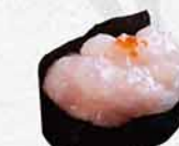
997 甜蝦蓉 甘エビたたき Tartare Sweet Shrimp