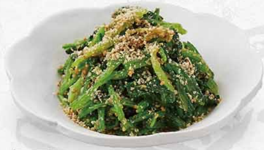
613 芝麻醬油汁菠菜 ホウレン草のごま和え Spinach Seasoned with Sesami Sauce $32