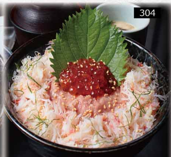
吞拿魚他他丼定食 $208 マグロタルタル丼セット Bluefin Tuna Tartare Bowl Set