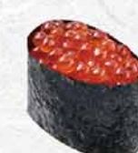
998 三文魚魚子 イクラ Salmon Roe