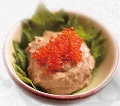
641 日本產生蟹膏 $98 生か二味噌 Japanese Crab Miso Paste