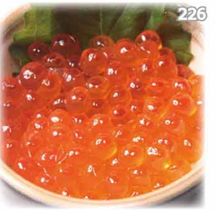
226 三文魚子 イクラ Salmon Roe $88