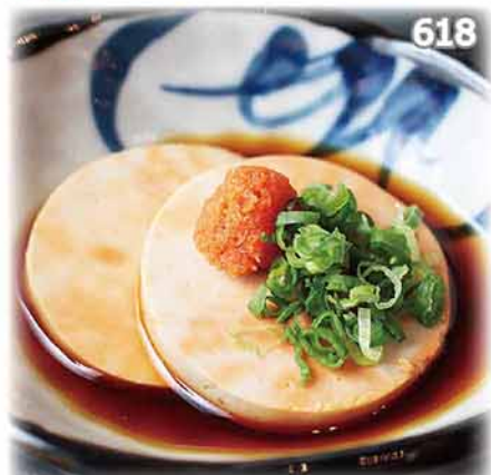
618 酸汁伴鮫鰵魚肝 あん肝ぽん酢 Monkfish Liver in Ponzu Sauce $68