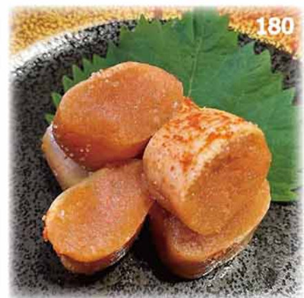
180 燒明太子 焼き明太子 Grilled Cod Roe $48