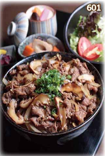
牛焼肉丼定食 牛ロース焼肉丼定食 Grilled Beef Bowl Set (with Teriyaki Sauce) $158 (单品・$128)