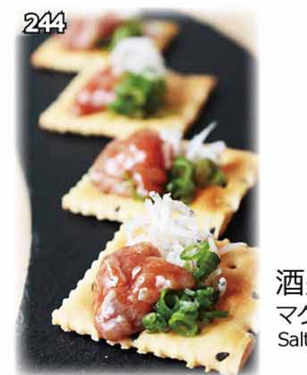
244 酒盜鹽漬吞拿魚腸餅 マグロ酒盜のカナッペ Salted Tuna Canape $58