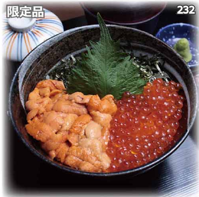
海膽配三文魚子丼定食 生ウニ・イクラ丼セット Sea Urchin & Salmon Roe Bowl Set