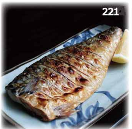
221 鹽燒鯖魚 サバ塩焼き Salted Grilled Mackerel $78