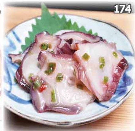
174 八爪魚芥辣漬 タコわさび Fresh Octopus Seasoned with Wasabi $38