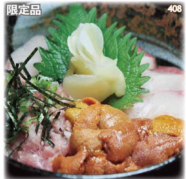
海膽,葱吞拿魚腩蓉,油甘魚三色刺身丼定食 生ウニ・ネギトロ・ハマチ三色丼セット Sea Urchin, Minced Fatty Bluefin Tuna, Yellowtail Bowl Set