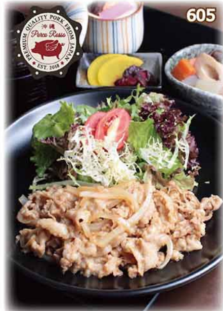
猪肉生薑燒定食 ~沖縄県産猪~ 豚しょうが焼き定食 ~沖縄県産三元豚 Porco Rosso 使用~ Japanese Pork Set (with Ginger Sauce) $98 (单品・$78)