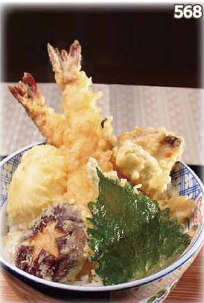
江戸前天丼定食 江戸前天丼定食 ~エビ2・白身魚・野菜2・半熟玉子~ Edomae Tendon Set $98