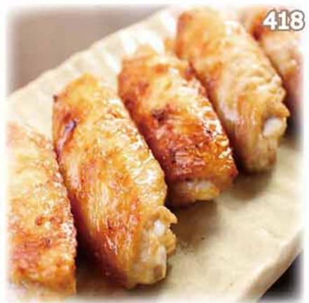
418 鹽燒秘製雞翼 手羽塩 Salted Grilled Chicken Wing $54