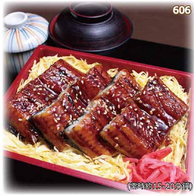
鰻魚盒飯定食 うなぎ錦糸重定食 Glaze-Grilled Unagi (Eel) Box Set $158