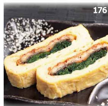
176 鰻魚菠菜玉子燒 うなぎ巻き Eel Japanese Egg Roll