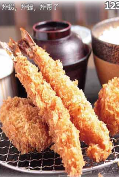
吉列海鮮定食 ミックスフライ定食 ~エビ2・カキ・ホタテ~ Shrimp, Oyster, Scallop Fried Set $118