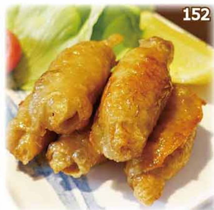
152 雞皮餃子 ~附生菜~ レタス巻きとり皮餃子 Chicken Skin Dumplin with Lettuce $58