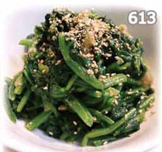
613 芝麻醬油汁菠菜 ホウレン草のごま和え Spinach Seasoned with Sesami Sauce $32