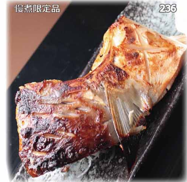
慢煮限定品 236 慢煮西京燒油甘魚鮫 ハマチ カマ西京焼き Grilled Yellowtail Collar Saikyo-style