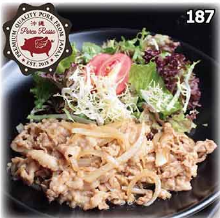
187 豬肉生薑燒 ~沖繩県産猪~ 豚のしょうが焼き ~沖繩県産三元豚 Porco Rosso 使用~ Grilled Japanese Pork (with Ginger Sauce)