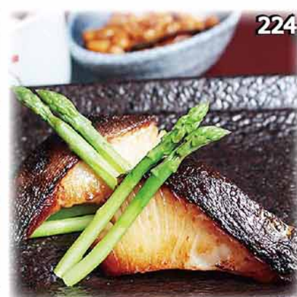
224 銀鱈魚西京燒(單品) 銀だら西京焼き Silver Cod Saikyo-yaki