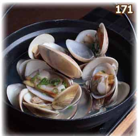
171 清酒煮蜆 アサリ酒蒸し Steamed Clam with Sake $68