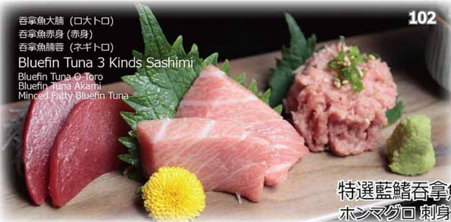
吞拿魚大腩 (口大トロ) 吞拿魚赤身 (赤身) 吞拿魚腩蓉 (ネギトロ) Bluefin Tuna 3 Kinds Sashimi Bluefin Tuna O-Toro Bluefin Tuna Akami Minced Fatty Bluefin Tuna