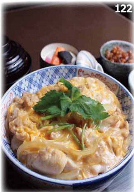
滑蛋雞丼定食 親子丼定食 Oyako-don Set (Chicken & Egg Bowl) $98