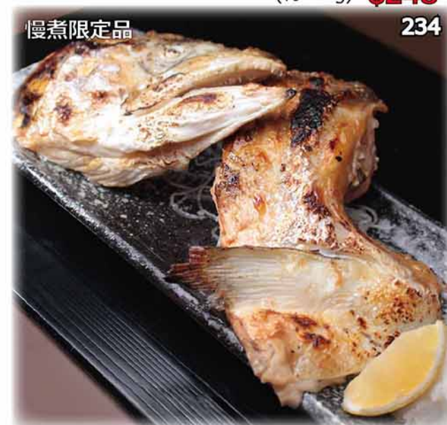
慢煮限定品 234 慢煮鹽燒三文魚頭鮫 サーモン兜塩焼き Salted Grilled Salmon Head