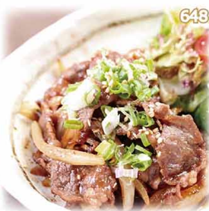
648 牛燒肉 (單品) 牛ロース焼肉 Grilled Beef (with Teriyaki Sauce)