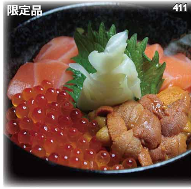
海膽,三文魚子,三文魚三色刺身丼定食 生ウニ・イクラ・サーモン三色丼セット Sea Urchin, Salmon Roe, Salmon Bowl Set