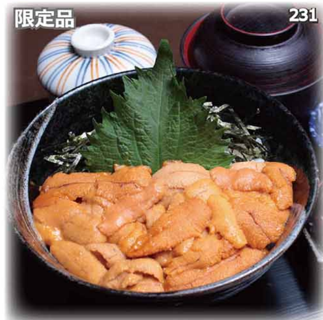
海膽丼定食 生ウニ丼セット Sea Urchin Bowl Set