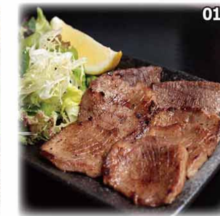
010 香煎牛舌片 牛タン焼き Grilled Beef Tongue $48 Set・$88