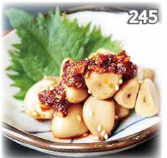
245 蒜肉醬油漬 ニンニク醬油漬け Garlic pickled in soy sauce $38