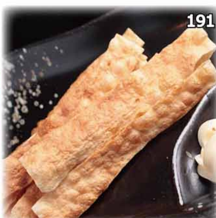
191 燒鱈魚棒 炙りタラロール Grilled Cod Fish