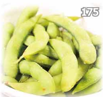
175 枝豆 Green Soybeans $28