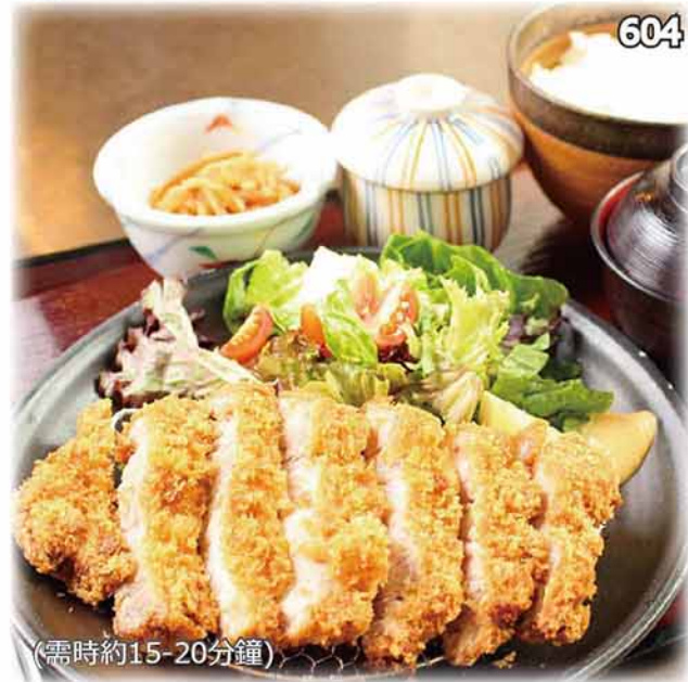
吉列猪扒定食 ~北海道白樺猪~ ロースかつ定食 ~北海道白樺豚使用~ Japanese Pork Cutlet Set $138 (单品・$108)