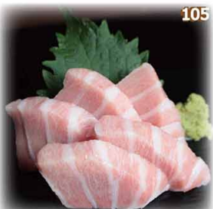
特選藍鰭吞拿魚三色刺身 ホンマグロ刺身 (3点盛り)