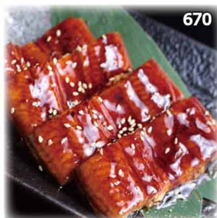
670 浦燒鰻魚 うなぎ浦焼き Glaze-grilled Eel