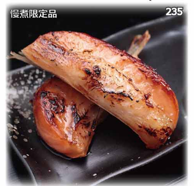
慢煮限定品 235 慢煮三文魚腩西京燒 サーモンハラス西京焼き Salted Grilled Fatty Salmon Belly