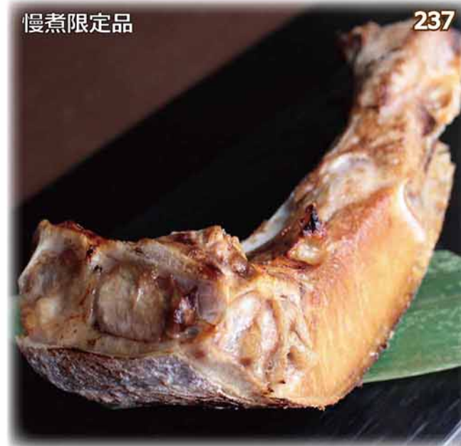
慢煮限定品 237 慢煮鹽燒藍鰭吞拿魚鮫 ホンマグロ カマ塩焼き (約300g) $128 Grilled Tuna Collar (約400g) $168 (約500g) $208 (約600g) $248