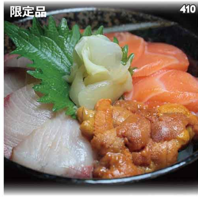
海膽,油甘魚,三文魚三色刺身丼定食 生ウニ・サーモン・ハマチ三色丼セット Sea Urchin, Salmon, Yellowtail Bowl Set