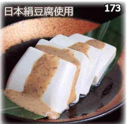
173 和風培煎醬冷豆腐 ごまだれ冷奴 Japanese Cold Tofu $46