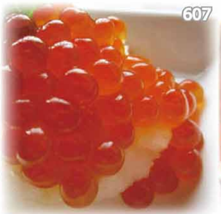
607 蘿蔔蓉伴三文魚子 イクラおろし Salmon Roe with Grated Japanese Radish $68