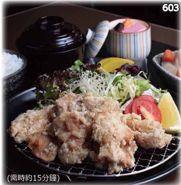
秘製炸雞球定食 どらや特製からあげ定食 Doraya Deep Fried Chicken Set $88 (单品・$54)