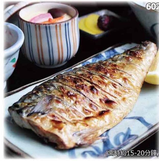
鹽燒鯖魚定食 サバ塩焼き定食 Grilled Mackerel Set $98 (单品・$78)