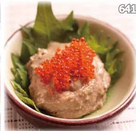
641 日本產生蟹膏 生力二味噌 Japanese Crab Miso Paste $98