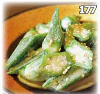
177 芝麻拌秋葵 オクラごまよごし Okra Marinade with Sesami Dressing $32