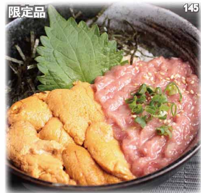
海膽配藍鰭吞拿魚腩蓉丼定食 生ウニ・ネギトロ丼セット Sea Urchin & Minced Fatty Bluefin Tuna Bowl Set