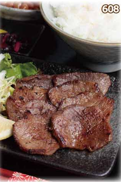
香煎牛舌片定食 牛タン焼き定食 Grilled Beef Tongue Set $88 (单品・$48)